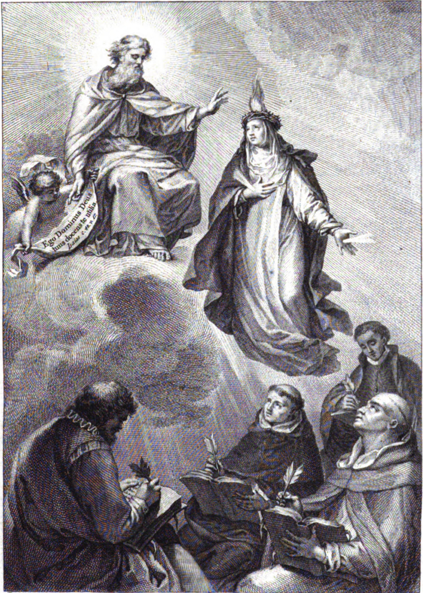
Joseph Meiss la dibujó.